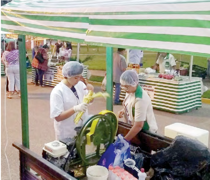
Não deixe de conferir mais esta delícia na Praça de Alimentação da Feira

Agora, a população e turistas que consomem produtos da Feira Noturna dos Produtores de Piedade também têm a oportunidade de saborear o tradicional caldo de cana, mais uma novidade oferecida no local todas às sextas-feiras. O “carrinho” de caldo de cana está no espaço da praça de alimentação, onde já estão disponíveis as barracas de pastel, da culinária japonesa e de turismo, que também comercializa bolos, sucos e outros alimentos.