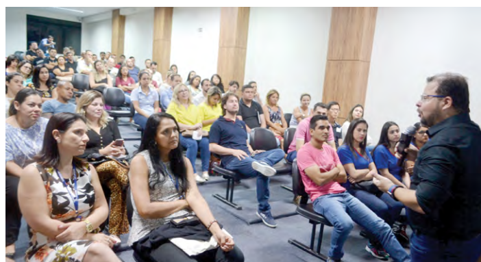
O público lotou o auditório da ACIP