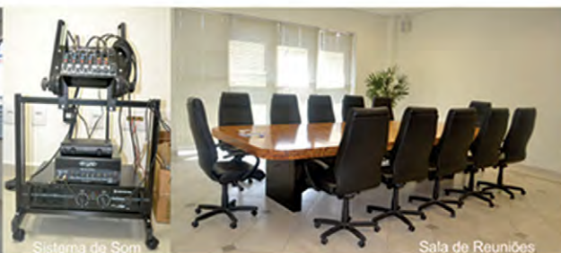
Sistema de Som