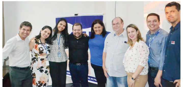
Equipe da ACIP e palestrantes

“Não adianta investir em uma fachada linda, colocar bons preços e os consumidores não serem bem atendidos. É preciso investir em mão de obra qualificada e fazer treinamentos constantes com os funcionários”, frisou a nutricionista. “A ACIP está de parabéns em promover eventos como esse. Através destas palestras, os profissionais obtêm mais conhecimento para alavancar as vendas da sua empresa”, assegurou.