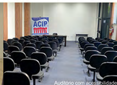
Auditório com acessibilidade

Rua Cônego José Rodrigues, nº 63 - Centro - Piedade SP