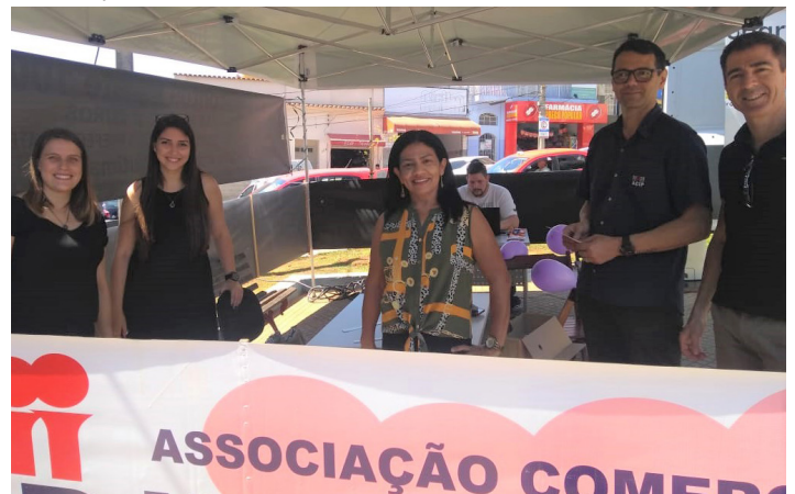
Presidente da ACIP, gerente comercial e funcionários da Prefeitura durante ação na praça