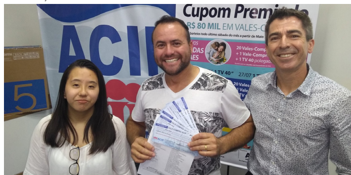
Ganhador recebe vales-compras