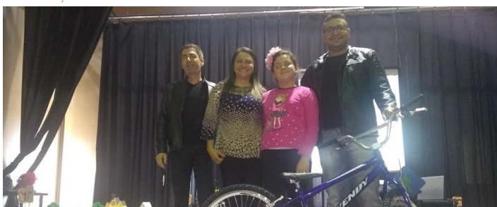
Presidente da ACIP e Secretário de educação entregam bicicleta a um dos ganhadores