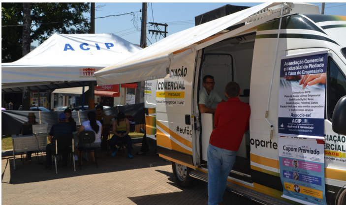
Consumidores aproveitaram oportunidade para solicitar consultas a ACIP