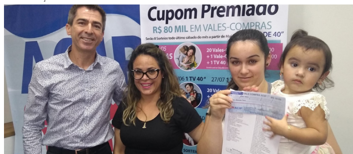
Uma das ganhadoras do prêmio de R$ 500,00