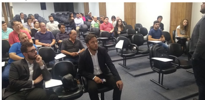
Público presente na palestra