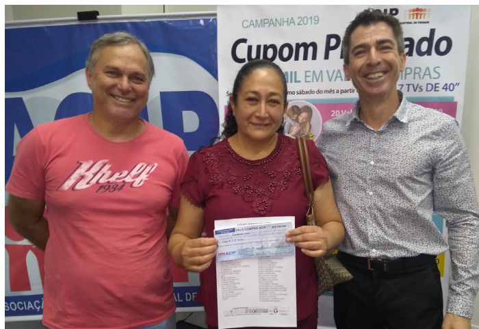
Ganhadora do prêmio de R$ 5 mil