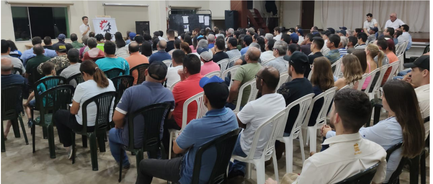
Evento reuniu mais de 200 produtores rurais

A palestra sobre Rotulagem e Rastreabilidade de alimentos, que ocorreu no dia 11 de setembro, no auditório da Associação Cultural e Esportiva de Piedade (Kai Kan), reuniu mais de 200 produtores rurais. Representantes da Associação Comercial e Industrial de Piedade, da Administração Municipal, da Secretaria de Desenvolvimento Rural e Meio Ambiente, do Poder Legislativo e do comércio da cidade também estiveram presentes.