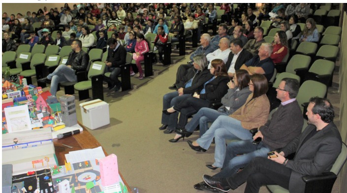
Evento conta com presença de estudantes e autoridades municipais