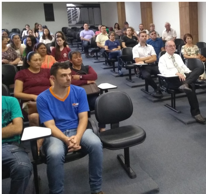
Dia da entrega dos prêmios

"Gostaria de agradecer a participação de todos os ganhadores e as empresas participantes desta importante ação promovida para fortalecer o comércio de Piedade", destaca o presidente da ACIP. "Vamos continuar comprando na nossa cidade, muitos prêmios ainda serão sorteados", ressalta.