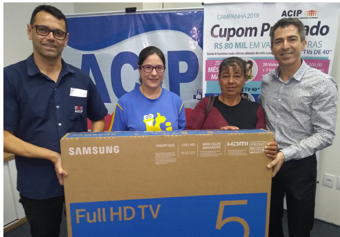
Ganhadora da TV de 43 polegadas