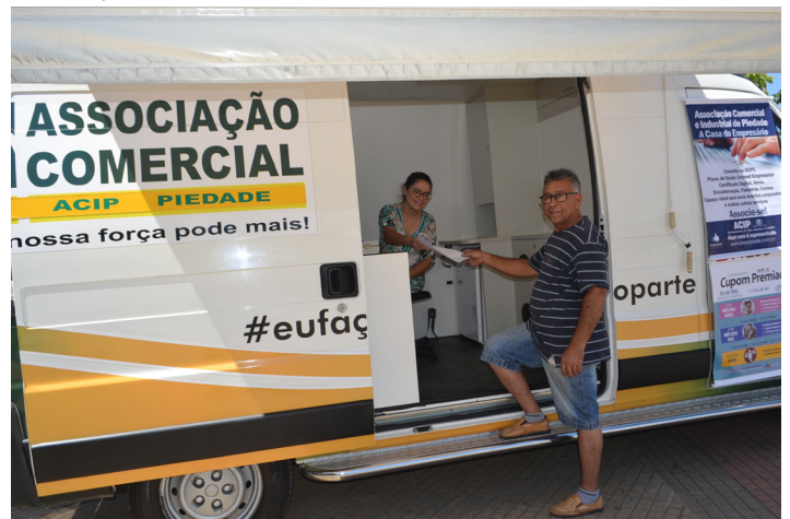
ACIP realizando atendimento ao consumidor