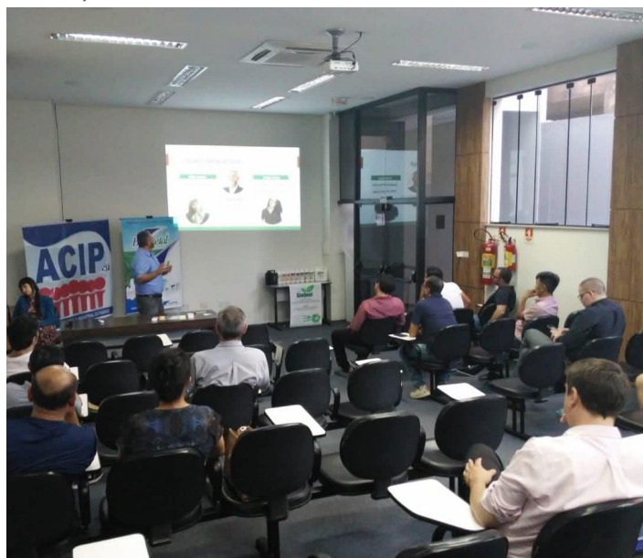
Empresários do setor participam do encontro