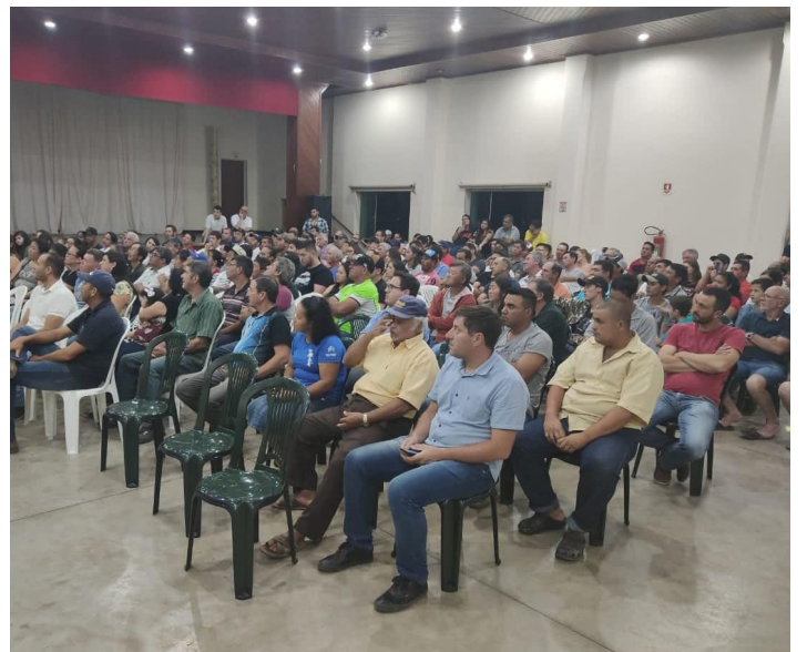
Palestra conta com a presença de representantes de autoridades municipais