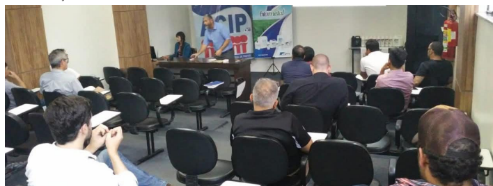
Empresários do agronegócio