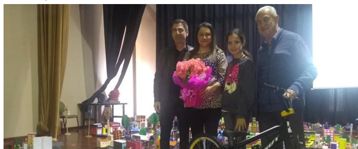
Empresários de vários segmentos participam do evento